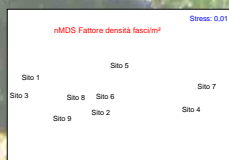
Fig.3 - MDS su matrice di similarità "Bray Curtis" stimato per la variabile densità.