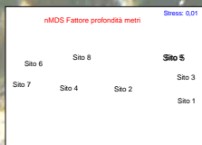
Fig.2 - MDS su matrice di similarità "Bray Curtis" stimato per la variabile profondità.