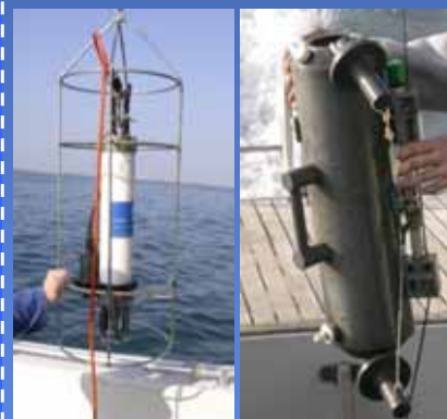
Figura 3: sonda multiparametrica