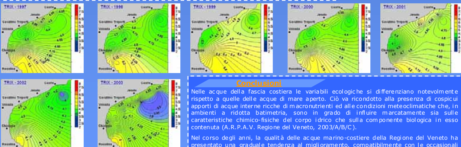
Figura 6: mappe di distribuzione del TRIX dal 1997 al 2003 realizzate utilizzando il "Kriging" come metodo geostatistico